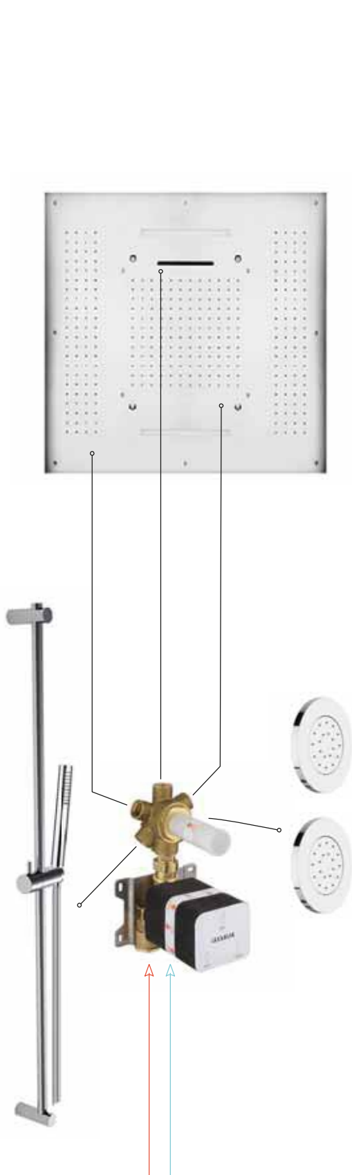
5 Uitgangen Zonder gelijktijdigheid